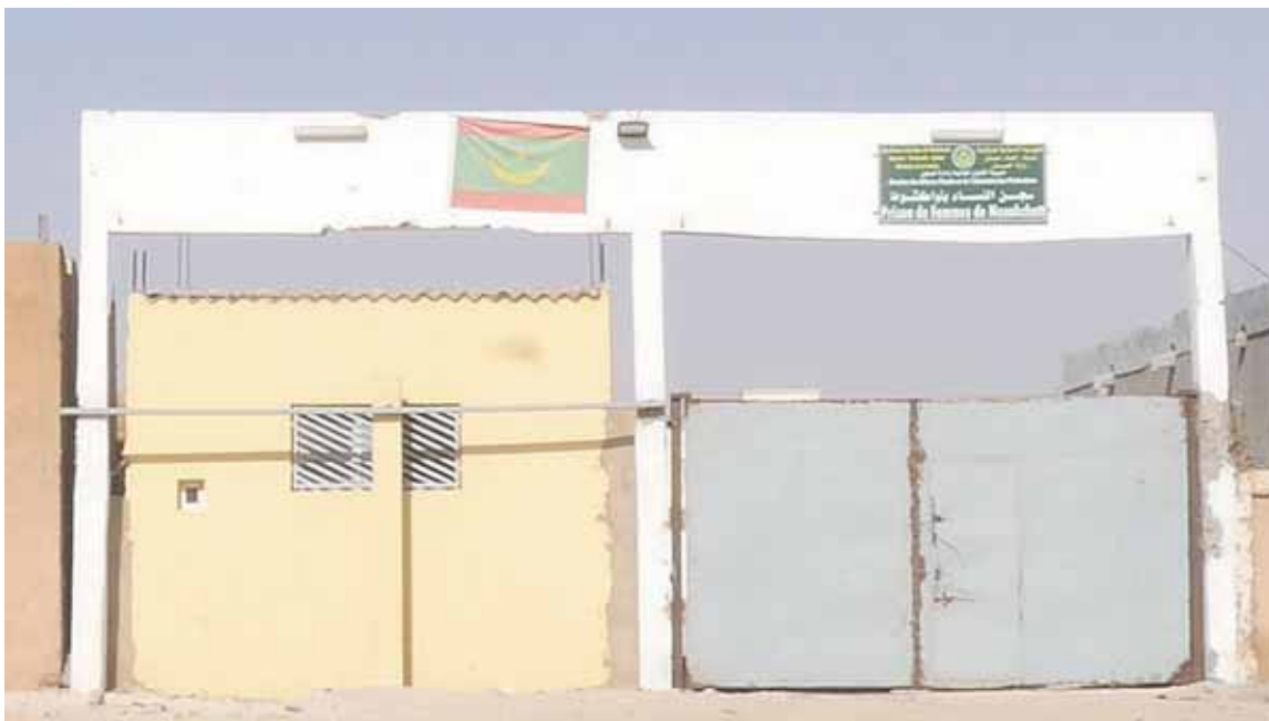
Entrée de la prison pour femmes, Nouakchott, Mauritanie, le 11 février 2018.

provisoire, mais sous contrôle judiciaire. Puis [les juges du tribunal] prononcent en général des peines de 3 à 6 mois de prison, fermes ou parfois avec sursis 118 . »