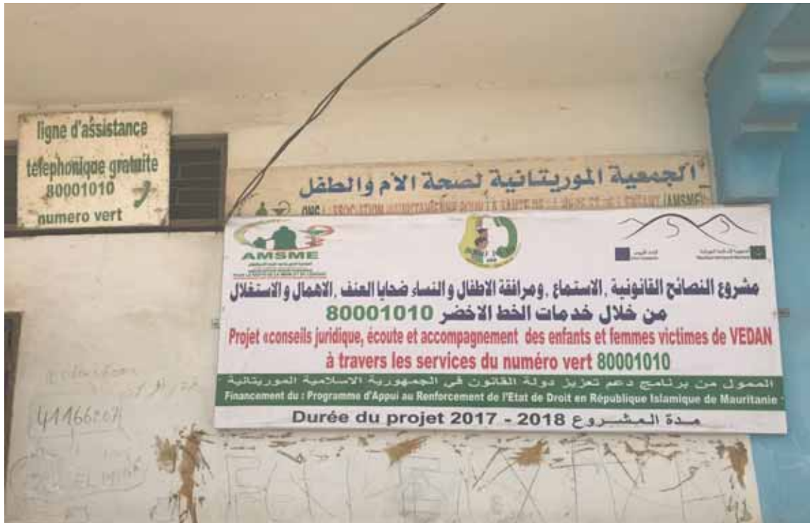
Affiche présentant une ligne téléphonique d'urgence opérée 24h/24 et 7j/7 par l'Association mauritanienne pour la santé de la mère et de l'enfant, Nouakchott, Mauritanie, le 30 janvier 2018.

En 2015, deux tiers des filles/femmes âgées de 15 à 49 ans rapportaient avoir subi une forme de mutilation génitale féminine (MGF) ou excision dans le passé. Les taux étaient nettement plus élevés dans les zones rurales que dans les zones urbaines (79 % contre 55 %). Pour les femmes ayant des filles, plus de la moitié rapportaient qu'au moins une de leurs filles âgées au plus de 14 ans avaient subi une forme de MGF ou d'excision.