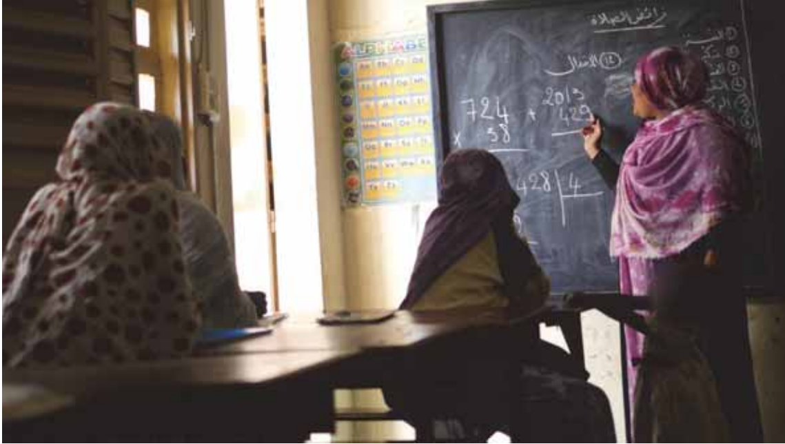
Des filles ayant survécu à des violences fondées sur le genre suivent un cours de mathématiques dans un centre géré par l'Association mauritanienne pour la santé de la mère et de l'enfant, Nouakchott, Mauritanie, le 8 février 2018.

parfois aussi une stratégie permettant de protéger la survivante d'un retour vers une situation où elle n'est pas en sécurité 129 .