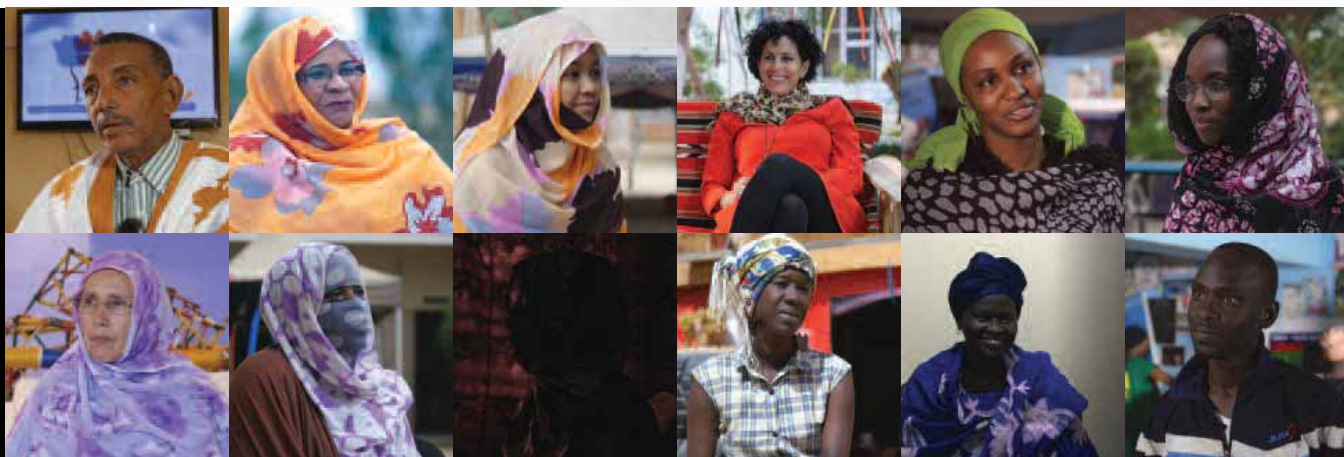
Des survivantes de viol, des représentants d'ONG et des activistes qui militent pour les droits des femmes et des filles en Mauritanie. Nouakchott, 2018.

Human Rights Watch appelle le gouvernement mauritanien à cesser de poursuivre et d'emprisonner pour zina , à décriminaliser ces actes et à libérer toute personne détenue pour ces motifs. Le gouvernement devrait adopter, une fois amendé, un projet de loi sur les violences fondées sur le genre—qui attend toujours d'être réexaminé par le parlement—afin que ce texte intègre une définition exhaustive du crime de viol, la pénalisation de toutes les autres formes de violences sexuelles, l'instauration de formations pour les forces de l'ordre, les autorités judiciaires et les professionnels de santé, la création de refuges à court et long terme et l'allocation de financements pour mettre en place ces réformes.