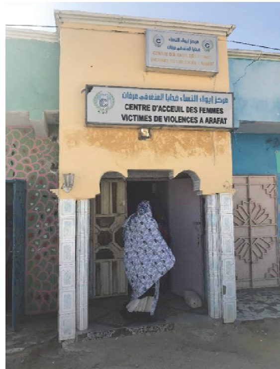
Centre d'appui aux femmes et filles survivantes de violences fondées sur le genre géré par l'Association des femmes chefs de famille, Nouakchott, Mauritanie, le 29 janvier 2018.