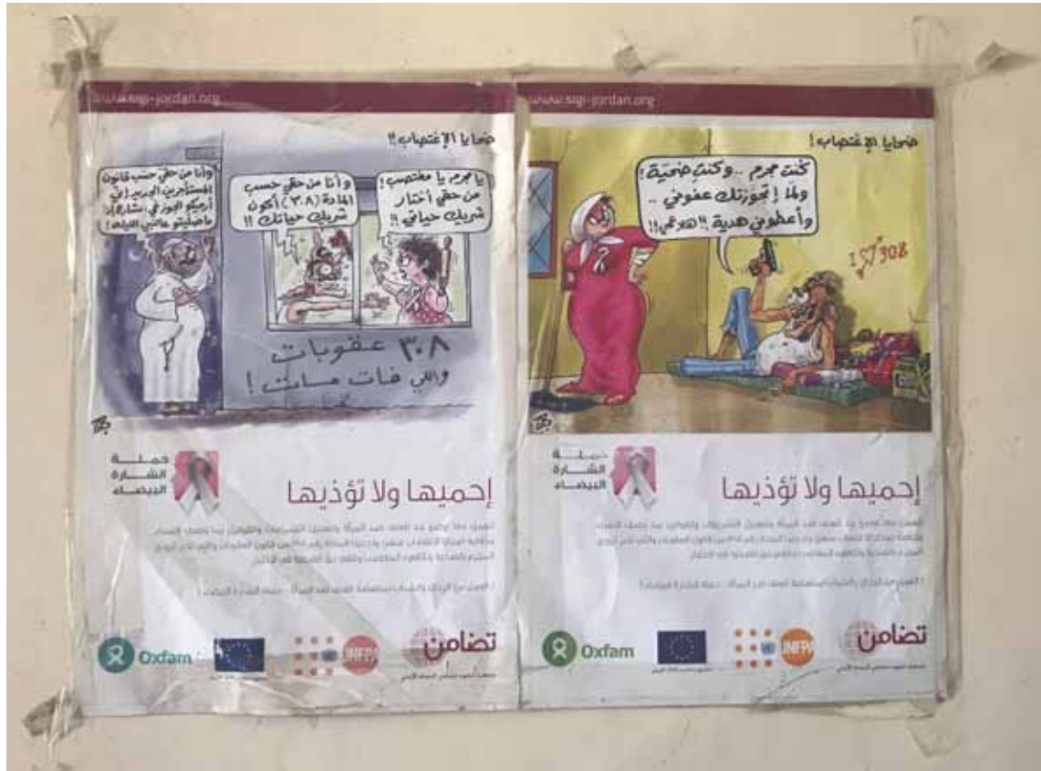
Affiche en arabe de sensibilisation aux violences fondées sur le genre, élaborée par le « Sisterhood is Global Institute » de Jordanie, parrainée par le Fonds des Nations Unies pour la population (UNFPA), l'Union européenne et Oxfam, ici exposée dans un centre d'appui aux femmes et filles survivantes de telles violences, géré par l'Association des femmes chefs de famille, Nouakchott, Mauritanie, le 23 janvier 2018.

D'après l'Office national de la statistique (ONS), en 2015, 27 % des MauritanienNES déclaraient qu'un mari avait le droit de faire preuve de violence physique envers son épouse (ou ses épouses) si elle sort sans le lui dire, si elle néglige ses enfants, s'ils se disputent, si elle refuse d'avoir des relations sexuelles avec lui ou encore si elle laisse brûler le repas 45 .