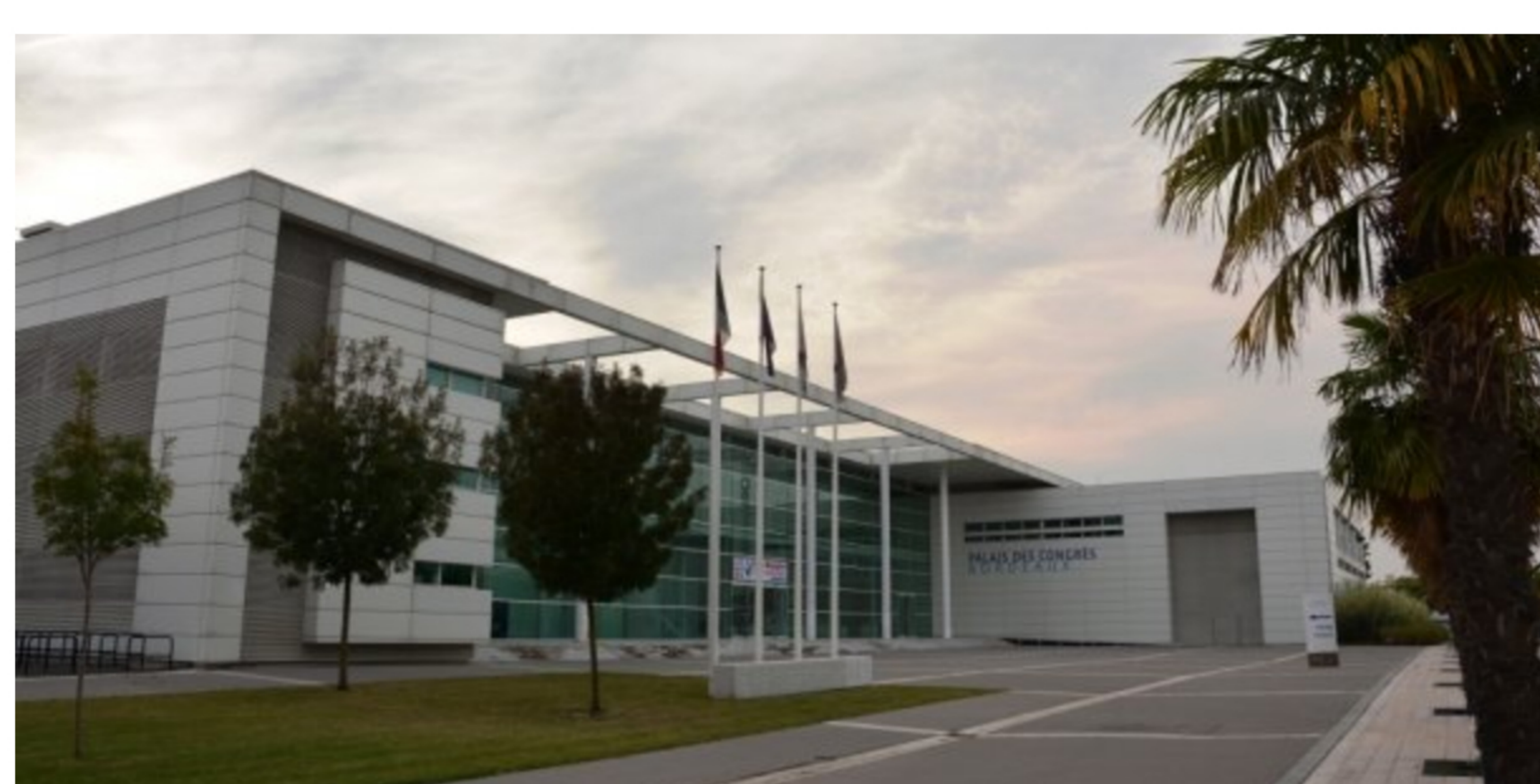
Congrès et Expositions de Bordeaux, qui accueille plus de 300 manifestations par an, propose aux entreprises et startups locales de tester leurs innovations à l'occasion d'événements qu'elle produit ou accueille.

En un an, le CEB Lab a accueilli une dizaine de startups et entreprises qui ont testé leurs solutions digitales sur les manifestations produites ou accueillies par Congrès et Expositions de Bordeaux. Après sa création fin 2015, l'heure est au bilan pour cette plateforme d'échanges et de tests mise à disposition de l'écosystème numérique local. Un bilan jugé positif. De nouvelles collaborations sont annoncées cette année.